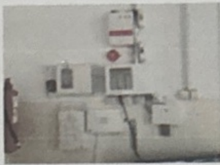
Ескерту жүйесінің болуы («дабыл күзгесі»)