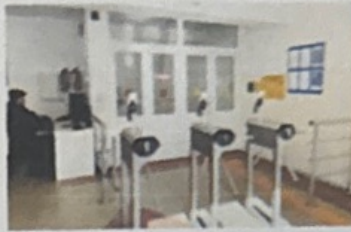
Кіруді бақылау және басқару жүйесі